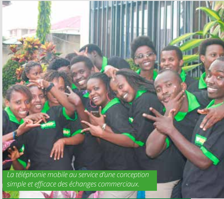
La téléphonie mobile au service d'une conception simple et efficace des échanges commerciaux.

Le Forum a également contribué, avec le concours financier du PNUD Niger, à la mise en œuvre d'un plan de travail biennal (2012-2013) encourageant l'entrepreneuriat des jeunes.