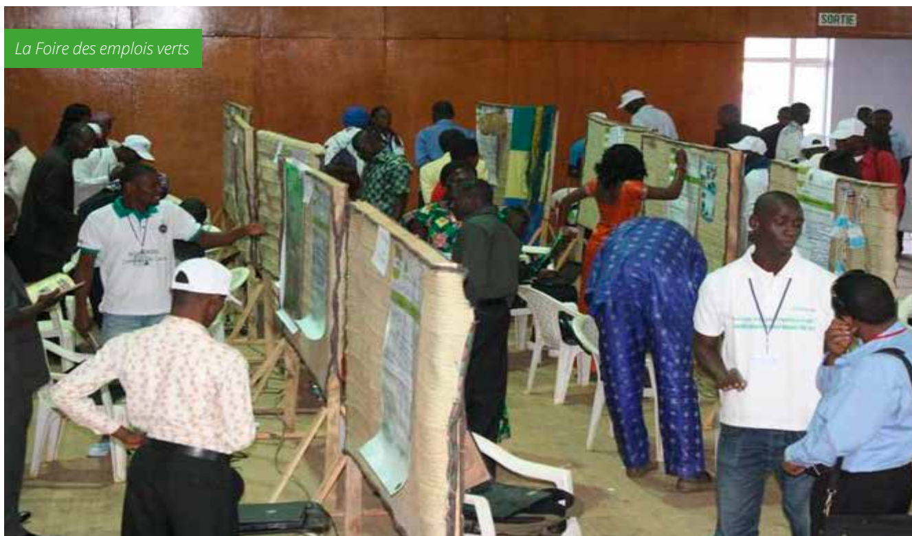
La Foire des emplois verts